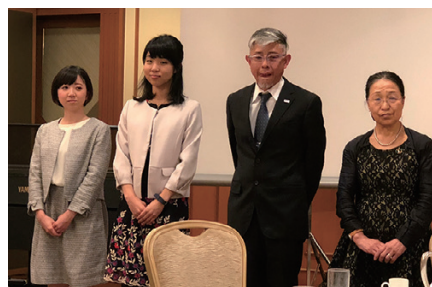
YMCA三条保育園のみなさま