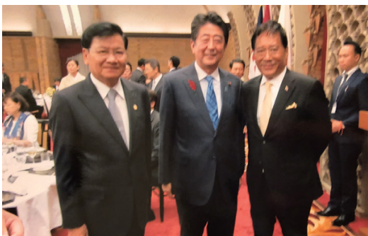
ラオスのトンルン・シーヌリット首相、安倍首相と大野ワイズ

去る10月初めに、メコン川流域五カ国の首相会議が日本で開催され、その最終の催しとして、10月8日首相公邸で晩餐会が開かれ、ラオス名誉領事として招待されました。