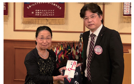
神戸園長先生、ありがとうございました