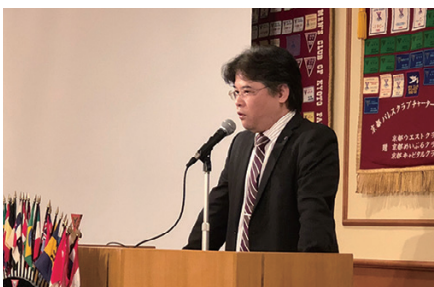
大森会長の開会の挨拶

これだけお世話になると、例会は私の生活の一部となっていますが、今回は新鮮さも感じ、愛着も感じられた例会となりました。