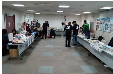
各クラブのブースの様