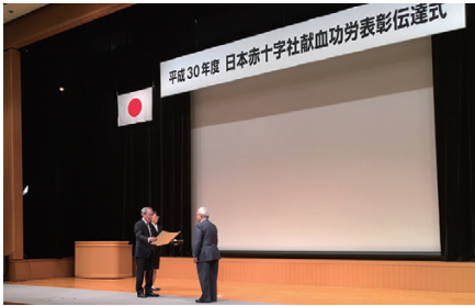
表彰伝達式の様子