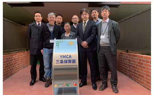
新しい看板を囲んでの記念撮影