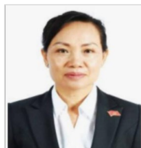
バイカム・カティニャ 労働社会福祉大臣