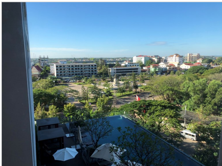
ビエンチャンの朝、ホテルの部屋からの眺めです。

明日は大使館に行って、 明後日は労働社会福祉大臣との面談をやります。 学校認可に向けての大詰めです。 パレスの事業に花が咲く時が来ました！