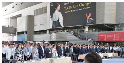
約3千名ワイズメン参加の式典スタート