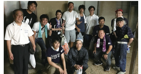
暑い中のかき氷最高です！お疲れさまでした！