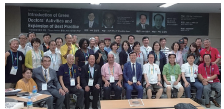
アジア太平洋地域メンバー