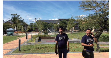
猛暑の中、参加のパレスマンお疲れさまでした！