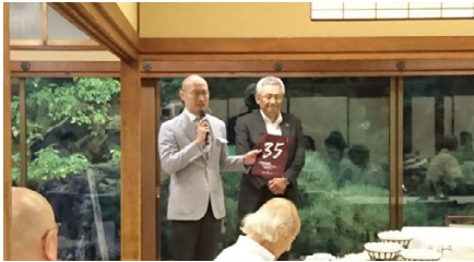
京都キャピタルクラブ35周年記念例会の告知に来られました！

また例会中には先日の水害被災者支援のための募金も行われ、メンバーのお気持ちが集められました。熱気冷めやらぬ中、例会は終了し各メンバーは帰路へ、2次会会場へ、夜の街へ？と向かうのでした。お疲れ様でした。