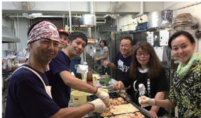
たこ焼き、美味しかったです！