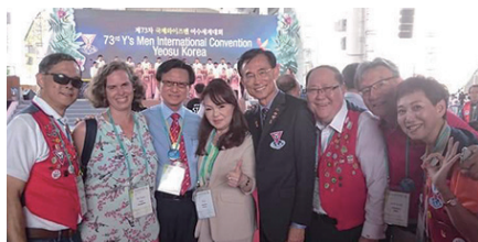
各国のICMメンバーと