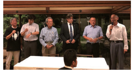
誕生日おめでとうございます！