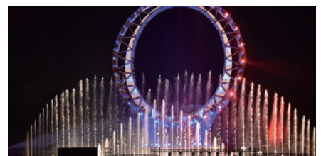
IPIPナイト 水上ステージ