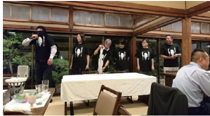
みんなでおそろいのTシャツ！