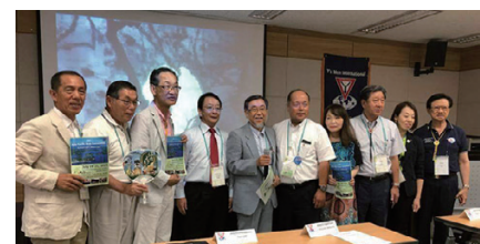
第28回アジア太平洋地域大会のHCC委員任命式