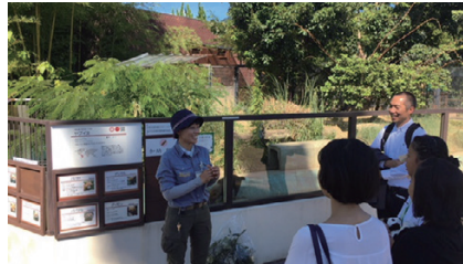
京都市動物園のみなさま、ありがとうございます！