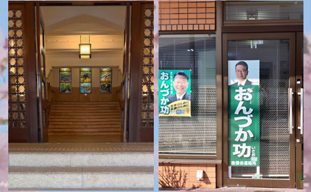
平成15年 京都市会議員に当選