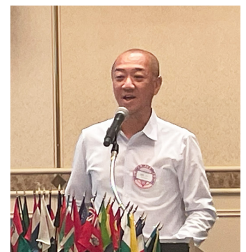
PN.ペイン(安田光ワイズ)