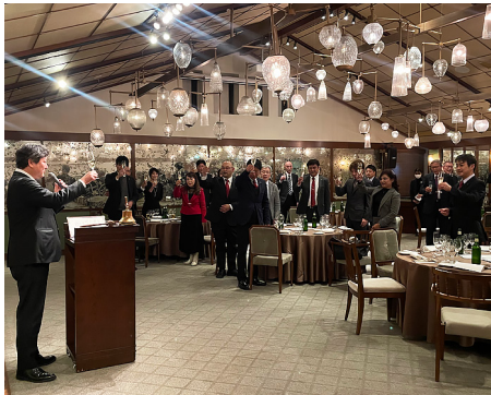
次期会長から乾杯の音頭