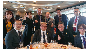
京都部の参加者とともに