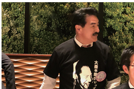
講演をして頂いた佐藤正久ワイズのパレスTシャツ姿