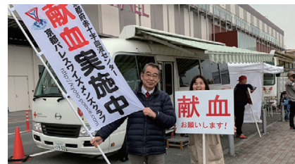
川上京都部部長も応援に来てくださいました