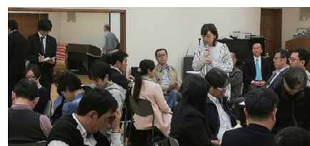
ユースリーダーによるまとめ発表