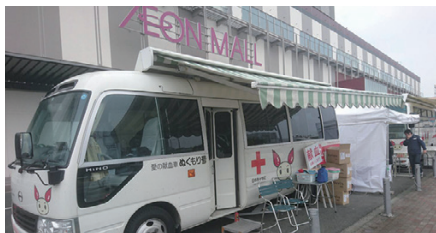
今回の献血の会場はイオンモール京都五条

私達の行動がたった一滴の水にすぎなくとも、その一滴の水が集まって必ずや大海になる(マザーテレサ)を信じて今後もパレスクラブは活動してまいります。