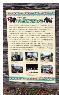
象の繁殖プロジェクト看板