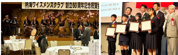
迫力のある太鼓のお出迎え