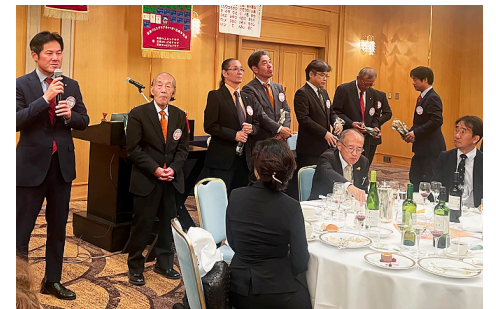
11月のハッピーアニバーサリーメンバー