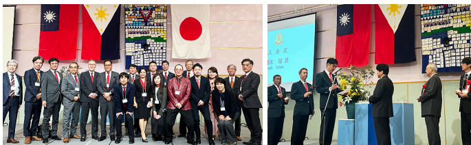
パレス参加者全員で記念撮影

記念例会は、第一部では式典と入会式、第二部の記念事業は多額の教育への寄付金と小中学生対象の作文コンクールの受賞者発表が行われ、熱海クラブらしい青少年奉仕活動が詰まった内容でした。第三部は太鼓やダンスと美味しい食事で大いに盛り上がりました。参加者全員大満足の内容だったと思います。