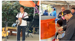
川上ワイズステージ 綿菓子作り