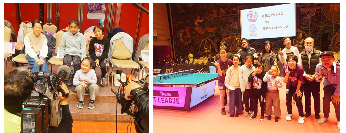
取材される子どもたち

イベントでは、子どもたちが選手たちの試合前練習を見学した後、試合で使用される本番台で選手たちと実際に卓球を楽しみました。子どもたちの中には、自分のシューズやラケットを持ってくる熱心な参加者もいました。CS委員会からは、観戦前に軽食とお菓子が提供され、イベントは大いに盛り上がりました。