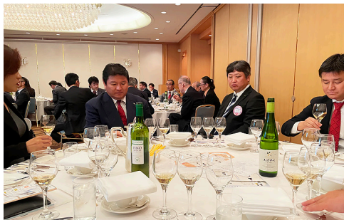
シャトー・メルシャン国産ワイン飲み比べを堪能