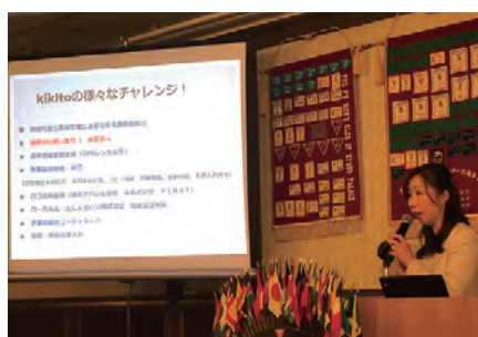
ゲストスピーカー大林さまによるお話