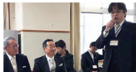
交流とお茶会での大森会長によるスピーチ