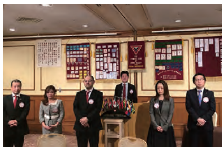
49期委員長が承認されました！

木のオブジェ、しいたけ、プロバスケ観戦チケット、近江牛カレー、ネックレスと様々な商品が出品されました。私は幼児用の積み木と昆虫スナックを購入しました。積み木は息子の初孫にプレゼントし、昆虫のスナックは、店にてスタッフとお客さんと一緒に頂きました。顔が引きつる方も居たり、美味しく食べている方も居たりで、みんなで大いに盛り上がりました。また今回のトスファンドはワイン、日本酒、ビールとお酒のオンパレード！3役のフルネーム入りボトルもあり、楽しい例会となりました。