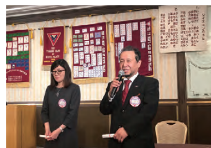
3月のハッピーバースデー