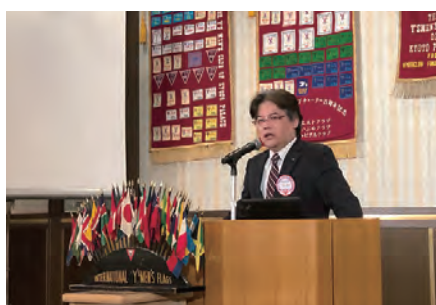
大森会長による開会挨拶

ニコニコでは次期委員長が次期に向けての抱負を語られ、次期が近づいてきたことを実感しました。