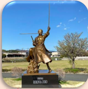
②ゾロ (大津町) 子どもたちと広場で剣の修行を重ね地震に負けないよう手助けします