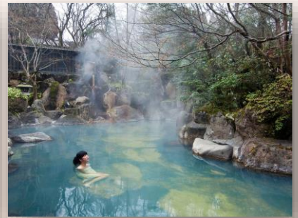
黒川温泉(南小国町) 全国でも人気の温泉郷、温泉3か所に入浴できる「入湯手形」も好評