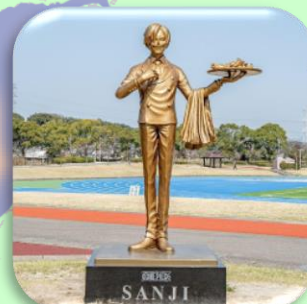
⑩ナミ (西原村) シンボルの風車と全集落の復興に応援の風を送り続けます