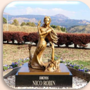
③ロビン (南阿蘇村) 歴史の語り部として研究を重ね記憶と教訓を語り継ぐのを手助けします