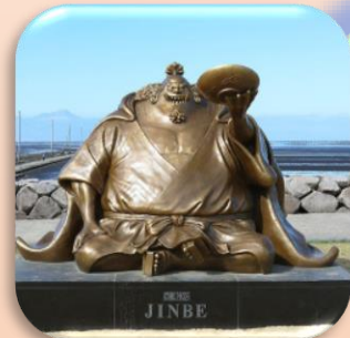
⑥ジンベエ (宇土市) 雄大な海を背に市民を見守り、更なる復興への舵取りを行います