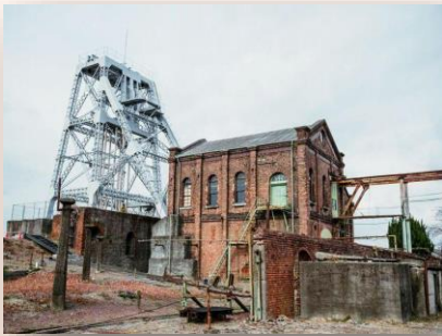
万田坑(荒尾市) 三池炭鉱の坑口、「明治日本の産業革命遺産」で世界遺産に登録