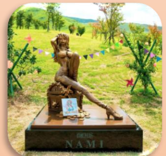
⑩ナミ (西原村) シンボルの風車と全集落の復興に応援の風を送り続けます