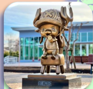
⑦チョッパー (熊本市) 動物たちのケアを行い子どもたちの笑顔を創り出します