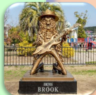
⑨ブルック (御船町) 復興への応援歌と軽快なジョークで住民の心の復興を後押しします