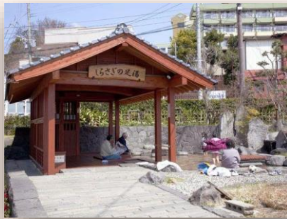
玉名温泉(玉名市) 白鷺が傷を癒すのを見て発見したという、1300年間湧き続ける温泉