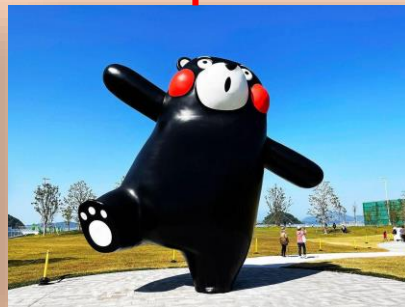
くまモンポート八代(八代市) 国際クルーズ船の受入れ拠点に併設の「くまモン」をテーマにした公園、様々なくまモン像がお出迎え