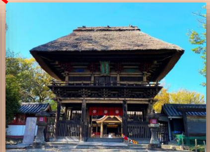
青井阿蘇神社(人吉市) 806年(大同元年)創建、本殿・廊・幣殿・拝殿・楼門は国宝に指定され地域の人たちの愛称は「青井さん」

古来から「肥の国(火の国、ひのくに)」といわれる熊本は、その名のとおり肥沃な土地柄に加えて清らかな湧水に育まれ、多くの農林水産物の生産地です。真っ赤なトマトやすいかは全国一の生産量。阿蘇のあか牛、新鮮な赤い真鯛やクルマエビなど熊本の「赤」をお楽しみください。