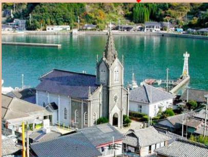
崎津教会(天草市) 「長崎と天草地方の潜伏キリシタン関連遺産」の構成資産のひとつとして世界文化遺産に登録