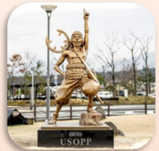
④ウソップ (阿蘇市) 緑(自然)の力を操る道具で草原の再生を手助けします