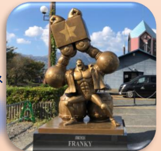
⑤フランキー (高森町) 鉄道の発着駅で全線再開への金槌を鳴らします