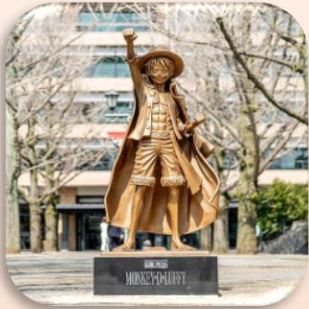
①ルフィ (熊本市) 麦わらの一味の仲間たちに熊本地震被災地復興の手助けを指示します

Story: 麦わらの一味の船長ルフィは仲間たちに被災地の復興の手助けを指示！仲間たちはそれぞれの特技で被災地の困りごとを解決し、復興へのエールを送るルフィのもとで再開を誓います。