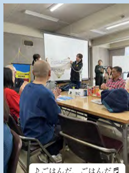
♪ごはんだ、ごはんだ♪