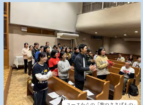
ユースからの「歌のささげもの」