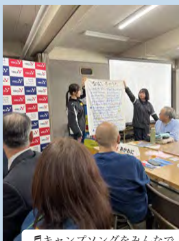
♪キャンプソングをみんなで♪