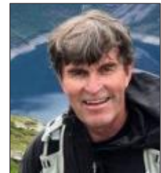
アドネ・ウェスネス ヨーロッパ