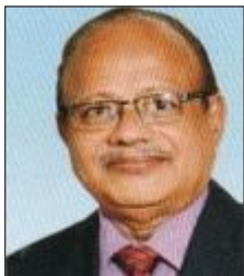
V・S・ラハルクリ シャオン インド