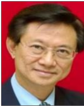
エドワード オン 次期国際会長