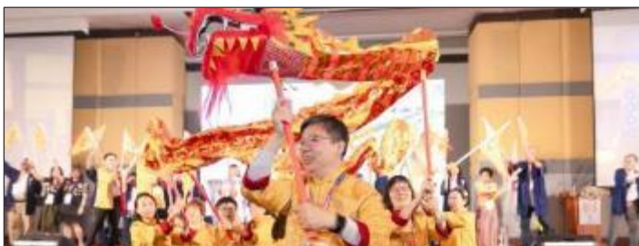
南東アジア区(香港部)のドラゴンドダンス