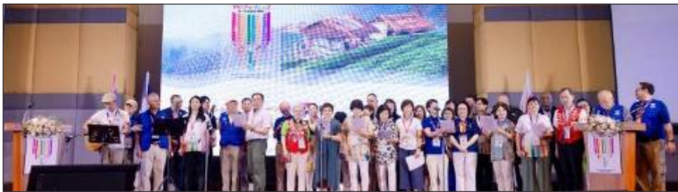
ソングフェスト合唱団