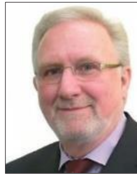
エリック ブレイオム 国際会計