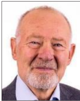
ウルリック ラウリドセン 直前国際会長