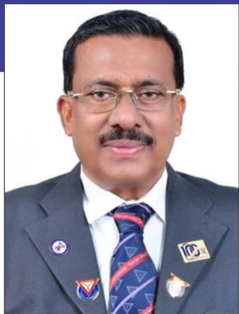
A・シャナヴァスカーン 国際会長