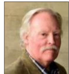
ダグラス・ジョーンズ 米国