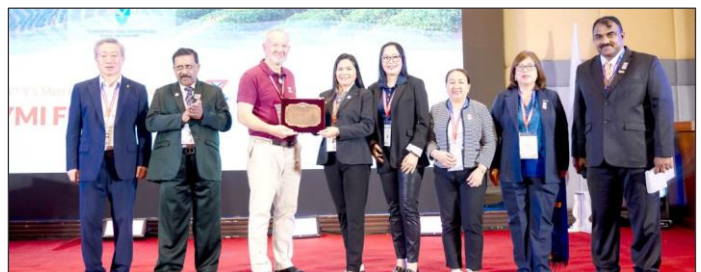
RAHAフィリピンクラブへの2022/23国際CS賞の授賞式