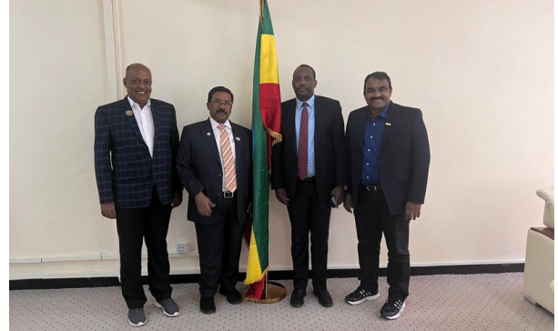
アディスアベバにて、シフェロー・シグ ティエ教育総局長（元教育・農業大臣）と会談