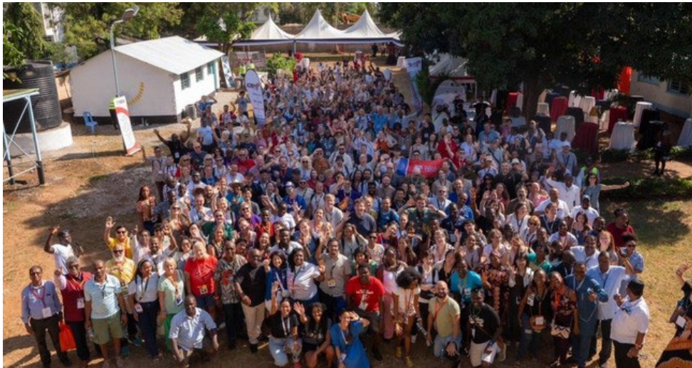
YMCAアクセラレーターサミットとモンバサでのアフリカYMCA/YMIリーダー会議