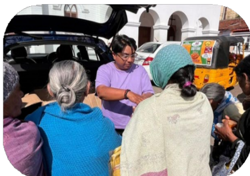
インド南西区、クーノークラブが恵まれない人に食事を提供