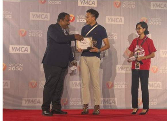
香港中華YMCAに「持続可能な地球に関するYMCAインパクト賞」を授与するジョース国際書記長