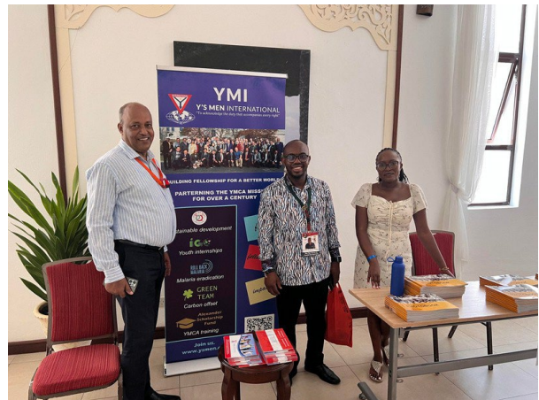
世界YMCA同盟執行委員会とYMIのプロモーションブース