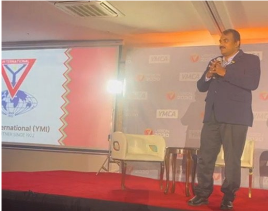
世界YMCA同盟アクセラレーターサミット本会議でワイズ運動を紹介するジョース国際書記長