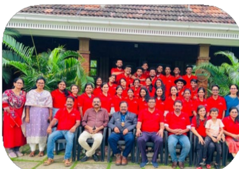
インド中西区のユースキャンプ