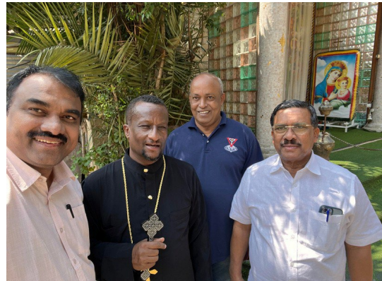
アディスアベバにてエチオピア 正教会主教と会談