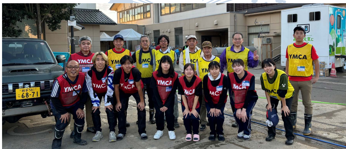
熊本YMCAからの来られていたの方々と一緒に写真撮影