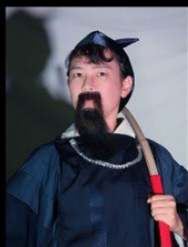
もののべのもりや 物部守屋