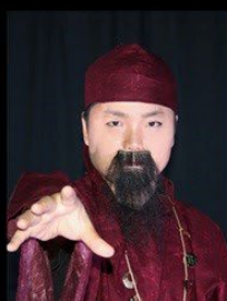
うまやどのみこ 厩戸皇子