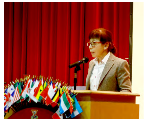
いのちの電話の講演

今回、部会を開催するにあたりまして多くの方々のお助けにより開催されましたことに感謝いたしております。「一期一会」の連鎖は有難いものです。これからも大切にしていきたいと思っております。