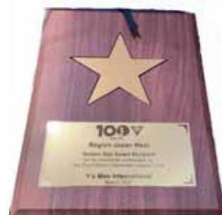
Golden Star Award Recipient