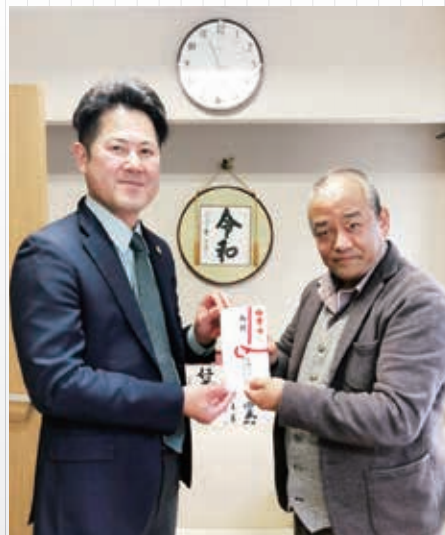
和敬学園奨学金贈呈