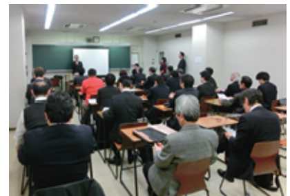
厳粛な TOF 例会の雰囲気

2月第2例会は TOF 例会で、会場をいつものブライトンホテルから YMCA に移し、また大野ワイズご紹介の西村様、谷口紹介の高山様をゲストに迎えて開催されました。