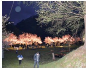
ライトアップされた夜桜