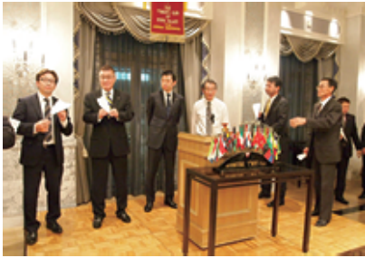
自慢の紙飛行機をアピール (パドック)