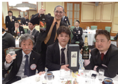
お酒も入ってご機嫌に落札