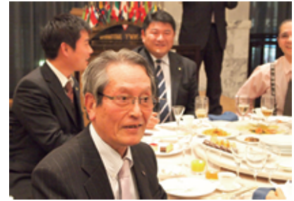
紙飛行機暴走! 全員ヒヤリ