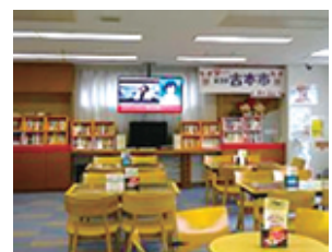
献血ルーム。皆さんも是非!