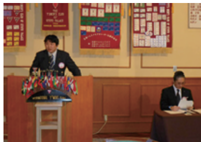
各委員長の引き締まった事業報告