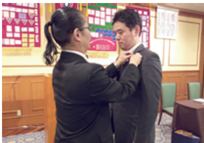
ようこそ堀ワイズ