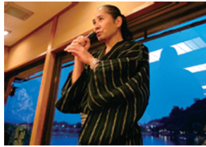
嵐山を背景に開会