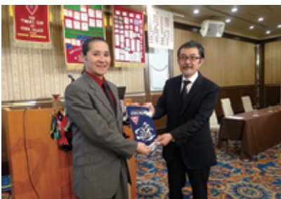
会長からゲストスピーカーへ最後のバナー贈呈