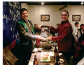
炭焼るまん家御所南店にて