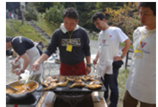
パレスクラブのタンドリーチキン

チャリティーラン等ではリーダー達の活動を垣間見ることは出来ますが、実際に交流する機会は少ないので、リーダーにワイズの活動を知って貰うだけではなく、私達もリーダーを知る良い機会であったと思います。今回参加できなかった方も次回(何年後か分かりませんが)是非ご参加を。