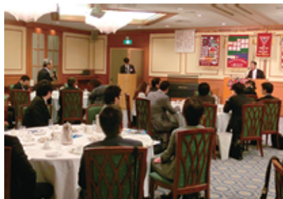
楽しいお話に質問も集中