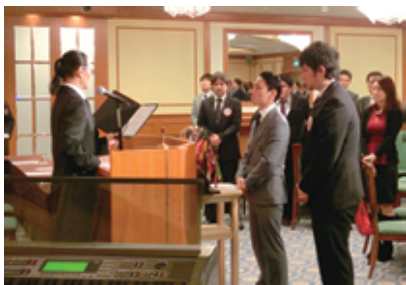
ようこそ梅戸荘平ワイズ