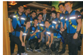
積極的なボランティアを実感

最後にこのような機会を与えられましたことを、心より感謝申し上げます。ありがとうございました。