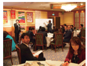
本当の自分発見!? 大盛り上がり!

今回の例会は、入会候補のゲストが2名参加され、また高山ワイズの入会式に続きEMCアワーも成功し、有意義な例会であったと思います。