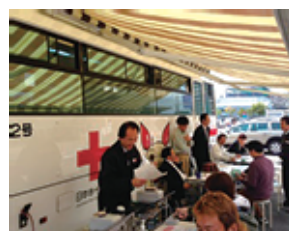
活気あふれる受付風景

人の役に立て自分の体調検査もでき、至れり尽くせりな献血ルームに行ったことのない方は是非一度行ってみてください♪