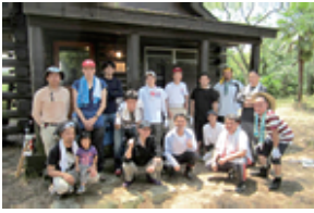
皆さんお疲れ様でした！