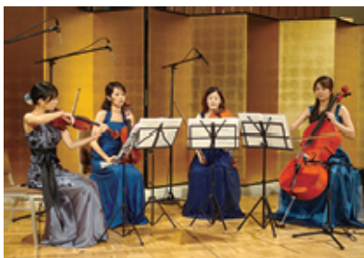
華やかなクラシック演奏