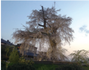
夕刻に映える美しい桜