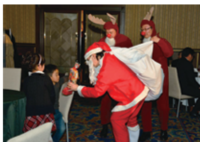
スタイルの良いサンタと汗だくトナカイ