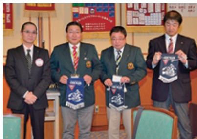
熱海クラブからは50周年記念例会のPR