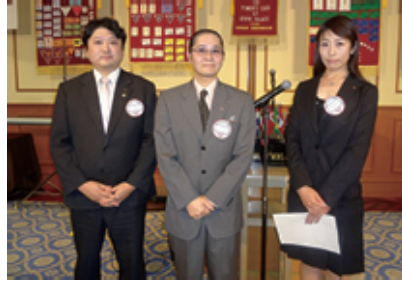
ようこそ宇野ワイズ