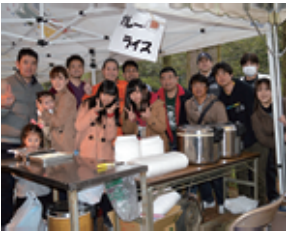
激うまカレー屋台