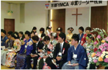
晴れ晴れしいリーダー達の門出

賛美歌合唱にて始まりました。25名のリーダーは壇上で和服やスーツのピカピカな正装姿なのですが、少し緊張した様子です。