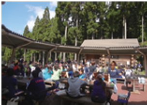
すばらしい秋晴れの空

今回で44回目を数える全国YMCAリーダー研修会とは、全国のYMCAの少年活動にかかわる青年リーダーの代表が集まり、青年指導者としての資質を高めるために行われているものです。そのリーダー研