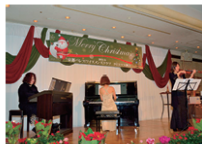
即興とは思えない息の合った演奏

テレビや街中ではクリスマス商戦を煽っていますが、肌感覚としてはクリスマスといわれてもピンと来ない今年のクリスマス。しかし、ブライトンホテル「英の間」で総勢90名超の参加で開催されたクリスマス例会は、キツリとクリスマスしていました。