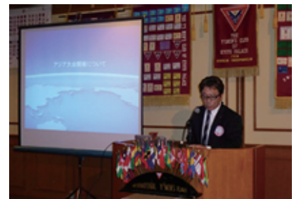
とても分かりやすかったプレゼン

1月第二例会、1月22日は半期総会の日であり、いつもより少々ピリッとした感じで例会は始まった。