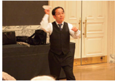
大人が真剣に楽しめました (レース)