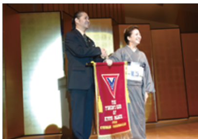
バナーセレモニー