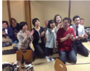
メネット・コメットも多数参加

今年の4月第一例会は円山公園近くの「いふじ」さんにてメンバー47名 メネット3名 コメット4名 ゲスト1名 計55名にて盛大に花見例会が行われました。各テーブルで、すき焼きを囲み、美しい庭を見ながらの和気藹々とした例会となりました。