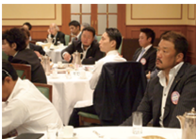
アジア大会に向けて真剣な眼差し