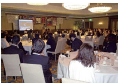
総勢88名の盛大な合同例会