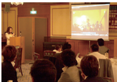
アジア大会の分かりやすい報告