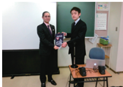
香取様スピーチありがとうございました