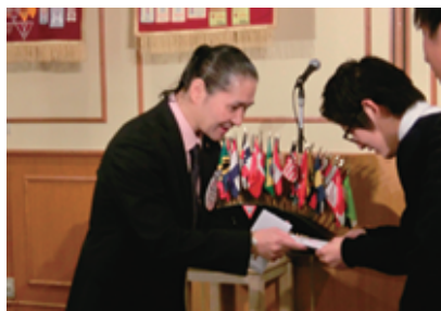
会長より奨学金の贈呈