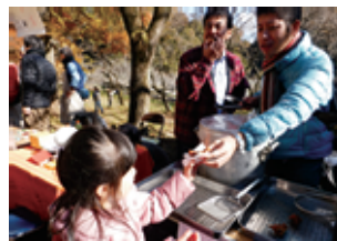
好天のもと唐揚げに舌鼓

京都パレスクラブ YMCA サービス・ユース事業、秋の恒例行事である京都YMCA リトリートセンター「オータムフェスタ」が、好天に恵まれ盛大に行われました。