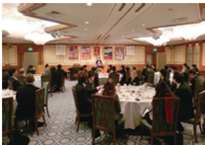
聞き慣れたお馴染みの声!?