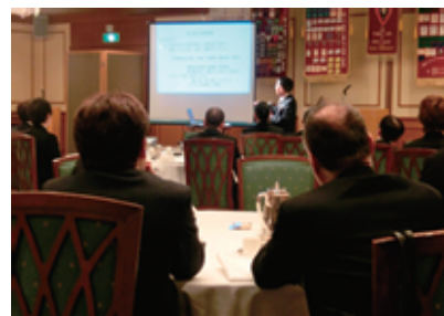
健康にも気を使いましょう!

年の瀬も押し寄せました12月第1例会、例会場はもうすぐ開会時間・・・、しかし空席が目立つ、さみしいナ～!!!