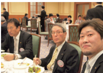
食事中のひとコマ