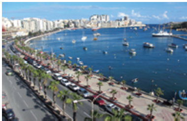
ホテルの自室から

昨年5月に、社長を息子に委ね、会長となったのを機会に、生涯やりたいたいと思っていた一か月間の仕事以外の海外生活を昨年暮れから実行しました。