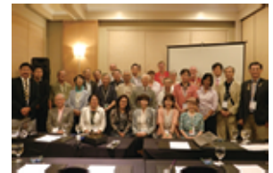
親睦にて文化の違いを実感