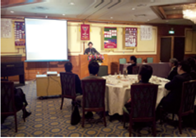
興味深い講演に聞き入るメンバー