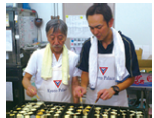
何でも似合う男前2人

たこ焼きはあっという間に無くなり、品切れに。すぐさま材料の買い足しが必要となるほどの人気ぶりでした。また、かき氷も好評を博しました。