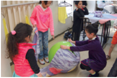
子供たちも積極的に参加

机が足りないから隣の教室から運んで!と、思いのほか大勢の参加者様にお集まりいただきYMCAの教室は楽しく作業に没頭する親子でいっぱいになりました。パレスクラブを一般の方々に知って頂くと言う目的の新たな広報活動として、今期が始まって以来メンバー皆で企画を練ってきたワークショップを2月22日(土)に開催しました。