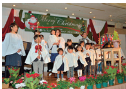
大勢の子供達によるキャンドルサービス