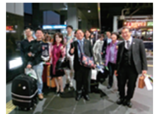
名残惜しく再会を誓って

がってしまい着々と手荷物が増えておりました。台湾のメンバーに興味ないかと尋ねると、『台湾には古いものが無い、あっても偽物である可能性が高いからあまり買わない』とのことでした。はっと歴史について考えました。その後、御池地下の喫茶店で休憩、三条河原町まで送り、パレスのこの日のプランは終了しました。