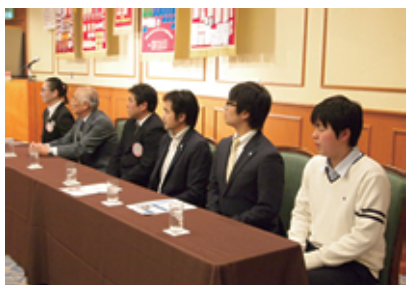
多彩なゲストを迎えた例会

紙面の都合上、すべてを記載できませんが、大変興味深いお話ばかりで、毎回ラジオを拝聴するのが楽しみになりました。