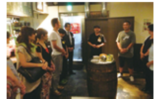
朝礼体験にドキドキ