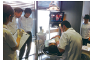
安田歯科医院にてボス治療中